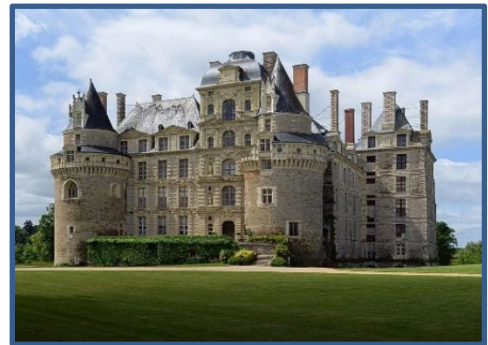
Château Brissac Quincé

// Dîner et nuitée au « Relais d'Orgemont »