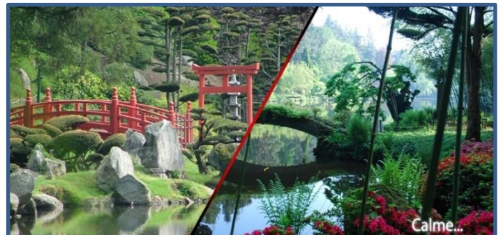
Parc de Maulévrier

En espérant que vous passerez un agréable et « doux » séjour. La commission des « Belles d'Hier »