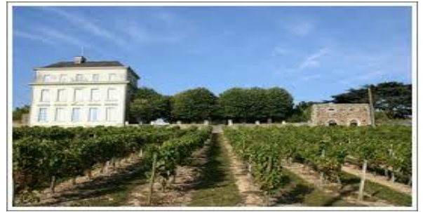
Château d'Avrillé - Vignoble Biotteau