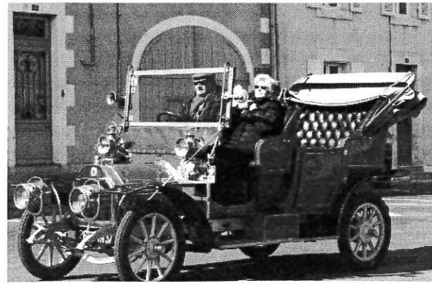
La Berliet de 1911.