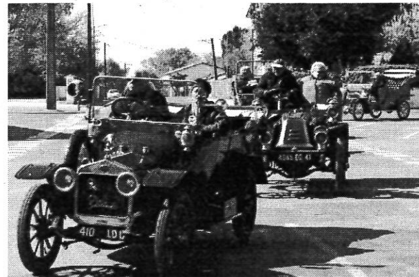
Au départ de Lezay, après s'être restaurés.

Le club organisera une autre randonnée pour les belles d'hier (voitures d'après 1939) les 29, 30 et 31 août sur un circuit allant au nord des Deux-Sèvres et qui passera au plus proche de chez nous à Saint-Maixent l'Ecole.